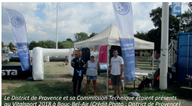
Le District de Provence et sa Commission Technique étaient présents au Vitalsport 2018 à Bouc-Bel-Air

Les 15 et 16 septembre derniers, le District de Provence était présent au Vitalsport 2018 organisé au Décathlon Village de Bouc-Bel-Air.