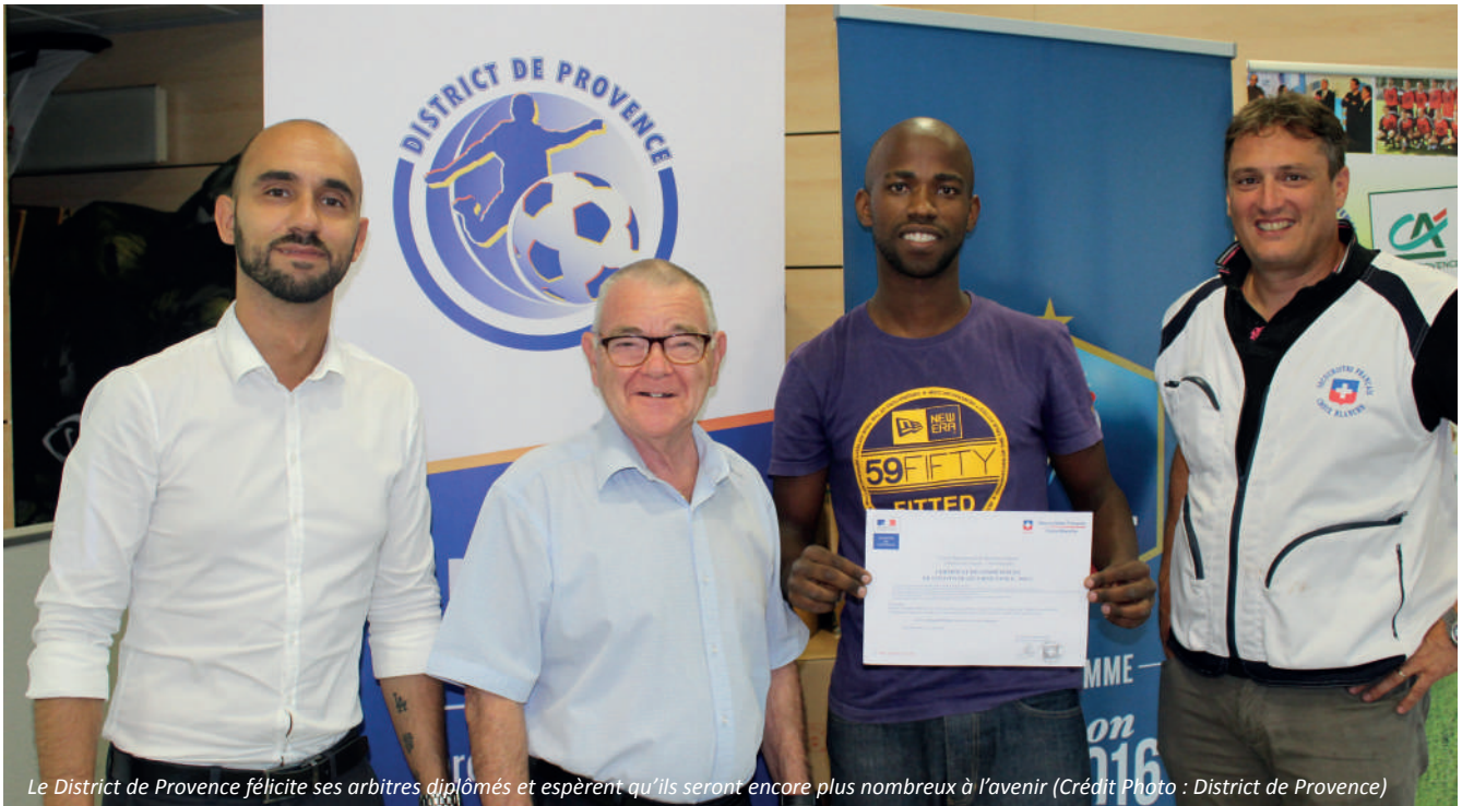
Le District de Provence félicite ses arbitres diplômés et espèrent qu'ils seront encore plus nombreux à l'avenir

Le 11 septembre dernier, les arbitres provençaux diplômés du PSC1 ont reçu leur certificat lors d'une remise protocolaire organisée par le District de Provence. Encore félicitations à nos officiels !