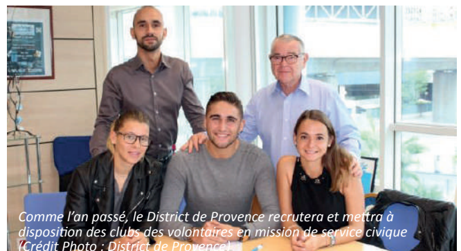
Comme l'an passé, le District de Provence recrutera et mettra à disposition des clubs des volontaires en mission de service civique

«On va poursuivre avec le recrutement de volontaires en service civique au sein du district et certains mis à disposition des clubs»