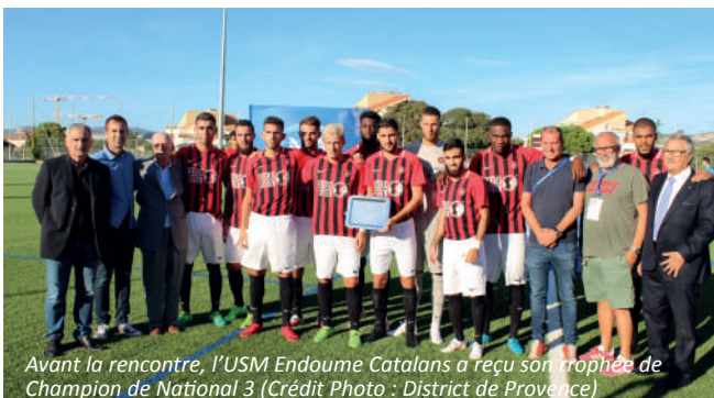
Avant la rencontre, l'USM Endoume Catalans a reçu son trophée de Champion de National 3

En marge de la rencontre, Endoume s'est vu remettre son trophée de Champion de National 3 acquis l'an passé, par la FFF.