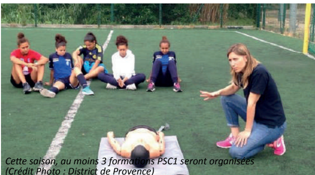
Cette saison, au moins 3 formations PSC1 seront organisées

«Ces formations PSC1 vont donc continuer. On en organisera une lors du dernier trimestre de cette année 2018 et au moins deux autres l'an prochain»