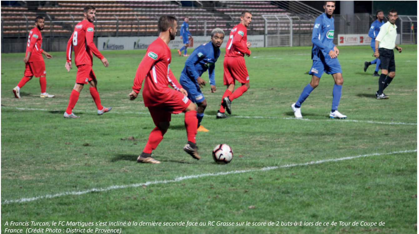
A Francis Turcan, le FC Martigues s'est incliné à la dernière seconde face au RC Grasse sur le score de 2 buts à 1 lors de ce 4e Tour de Coupe de France

Le 28 septembre dernier, le FC Martigues recevait le RC Grasse, équipe évoluant dans son groupe de National 2, pour un remake de la saison dernière. L'an passé, les deux équipes s'affrontaient déjà lors de ce 4e Tour de Coupe de France et Martigues l'avait emporté 3 buts 1 en prolongations. Retour sur cette rencontre.