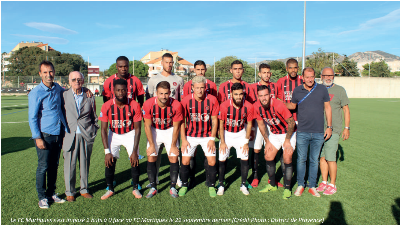
Le FC Martigues s'est imposé 2 buts à 0 face au FC Martigues le 22 septembre dernier

Le 22 septembre dernier à 18h, au Stade Roger Lebert, l'USM Endoume Catalans et le FC Martigues s'affrontaient lors de la 7e journée de National 2. Retour sur cette rencontre remportée 2 buts à 0 par les Endoumois.