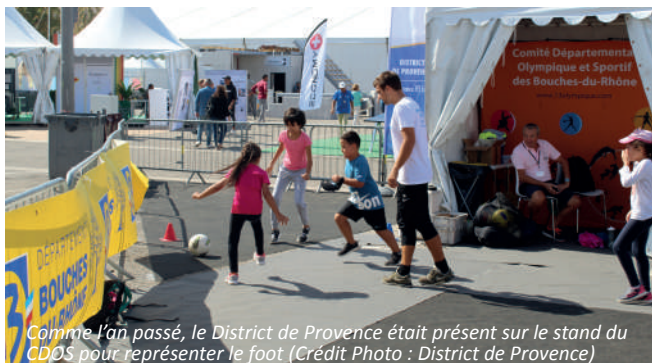
Comme l'an passé, le District de Provence était présent sur le stand du CDOS pour représenter le foot

Au cours de cet évènement, les visiteurs ayant participé aux animations ont pu obtenir un « coupon initiation gratuite en club ». Ce coupon a permis à chaque participant d'avoir la possibilité de se rendre dans le club de son choix (parmi une liste proposée) et de s'initier au football, durant une heure. Cette initiative avait pour but de faire découvrir les pratiques de notre sport à un nouveau public, et ainsi d'accroître le nombre de licenciés dans nos clubs.