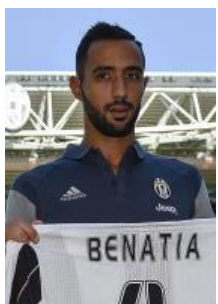
Mehdi BENATIA (Juventus Turin)

Né en région parisienne, Mehdi Benatia effectue cependant sa formation avec l'Olympique de Marseille. Le défenseur joue en CFA avant d'être prêté au Tours FC (2006-2007) en L2. Après un prêt d'un an au FC Lorient (2007-2008), Benatia signe à Clermont et retrouve la Ligue 2. En 2 saisons (2008-2010), il y dispute 57 matchs de championnat. En 2010, il file en Serie A à l'Udinese et devient un des meilleurs défenseurs du Calcio. En 2013, l'AS Rome le recrute mais dès la saison suivante, l'ancien minot s'engage avec le Bayern Munich où il sera sacré champion d'Allemagne. Après une saison difficile à cause des blessures, le défenseur central quitte la Bavière pour le Piémont et la Juventus de Turin.