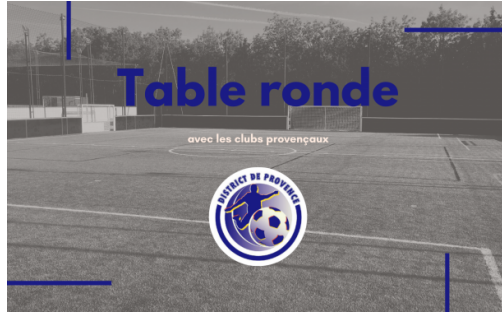
Table ronde communication

Plusieurs idées sont apparues à la suite de problématiques soulevées. Un réel moment d'échange mais aussi de convivialité qui nous a permis de prendre en compte les remarques et de trouver des axes d'amélioration pour que l'information soit transmise plus efficacement.