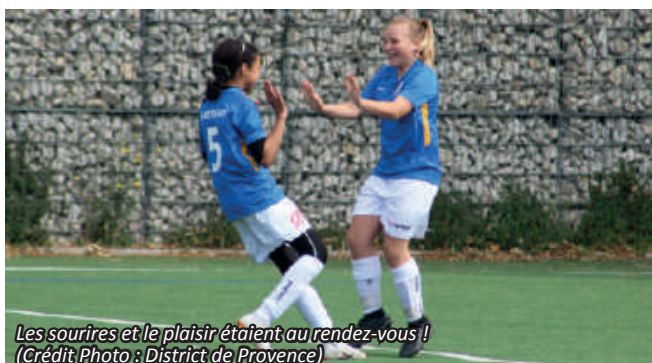
Les sourires et le plaisir étaient au rendez-vous !

prennent du plaisir sur le rectangle vert. Ce fut chose faite tout au long de la manifestation.