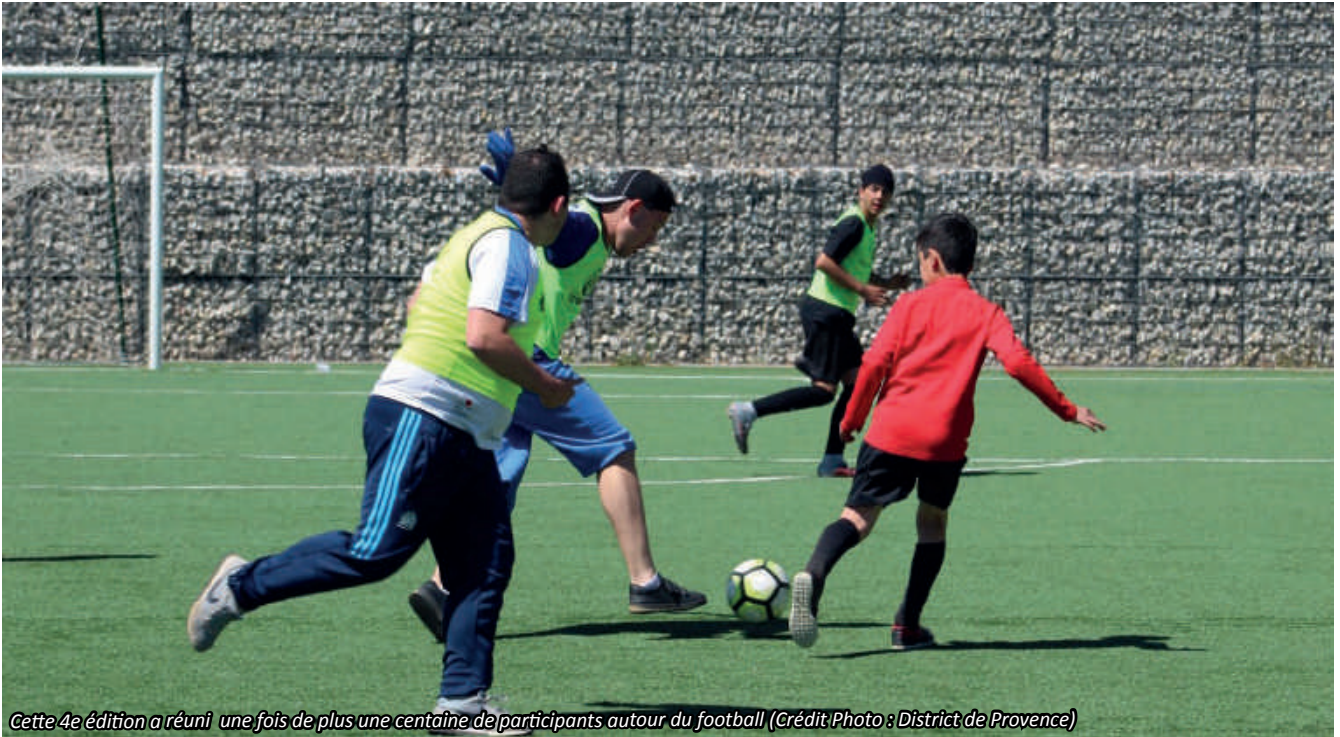
Cette 4e édition a réuni une fois de plus une centaine de participants autour du football

Le 4 mai dernier avait lieu la 4e édition de la manifestation "Tous Foot", au Complexe Sportif de Fontainieu. 4e édition et 4 années de plaisir et de partage ! Retour sur cette belle journée.