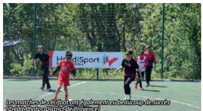
Les matches de cécifoot ont également eu beaucoup de succès

Après plusieurs rotations au niveau des ateliers, les participants se sont vus offrir un repas. Après la pause-déjeuner, à partir de 13h30, des oppositions de cécifoot ont eu lieu sur le city stade. Les initiés ont pu affronter l'équipe d'Endoume et se mettre à la place de déficients visuels, à l'aide de lunettes spéciales. Les matches se sont enchaînés dans la joie et la bonne humeur et la pratique a eu beaucoup de succès.