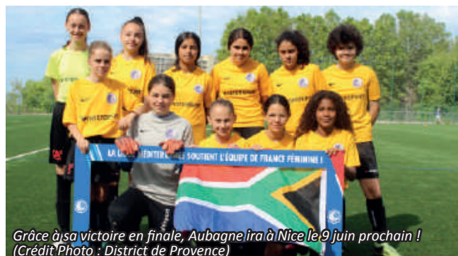
Grâce à sa victoire en finale, Aubagne ira à Nice le 9 juin prochain !