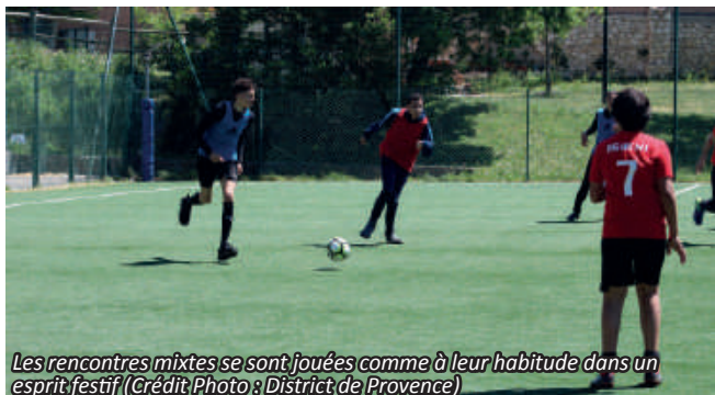
Les rencontres mixtes se sont jouées comme à leur habitude dans un esprit festif

En fin de journée, des récompenses ont été distribuées à l'ensemble des participants pour venir clôturer cette 4e édition de "Tous Foot". Merci au Club du St-Henri FC pour l'accueil et à tous les participants ! Vivement la 5e édition l'année prochaine ! Bientôt, retrouvez la vidéo de la journée sur nos réseaux sociaux et notre site internet.