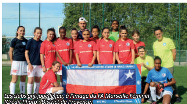
Les clubs ont joué le jeu, à l'image du FA Marseille Féminin

par nos partenaires Intersport et Crédit Agricole , les premières rencontres ont démarré aux alentours de 9h45, sous l'impulsion des hymnes nationaux. Notons que les équipes ont joué le jeu en venant maquillées et en arborant pour certaines le drapeau du pays qu'elles représentaient. Par ailleurs, parallèlement aux rencontres, divers ateliers (futnet, foot à 5, etc...) ont également été mis en place par la Commission Technique du District de Provence