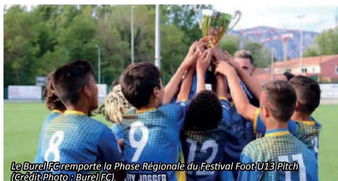
Le Burel FC remporte la Phase Régionale du Festival Foot U13 Pitch

Le 27 avril dernier avait lieu la Phase Régionale du Festival Foot U13 Pitch, au Complexe de la Plaine Sportive de Rousset. 6 clubs provençaux étaient en lice et c'est le Burel FC qui l'emporte chez les garçons !