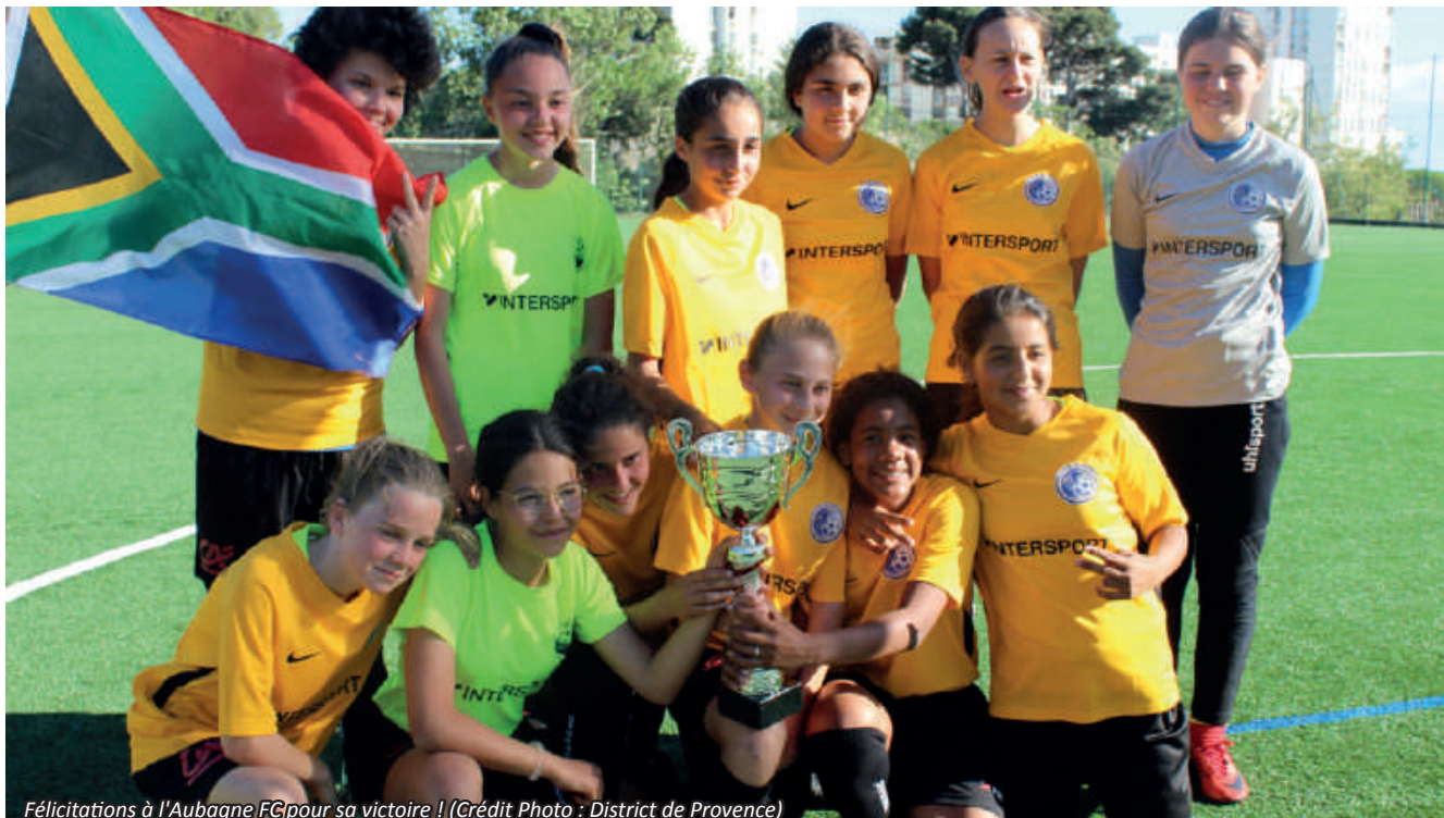
Félicitations à l'Aubagne FC pour sa victoire !

Le 11 mai dernier, le Complexe Sportif de Fontainieu accueillait la Phase Finale Départementale du "Défi Cup U15F La Mondiallette". 14 équipes étaient présentes dans la joie et la bonne humeur pour participer à cette mini Coupe du Monde. Retour sur ce bel évènement qui a vu le club de l'Aubagne FC l'emporter.