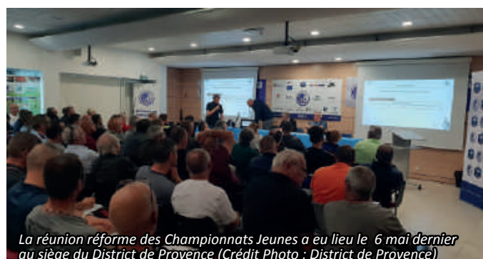
La réunion réforme des Championnats Jeunes a eu lieu le 6 mai dernier au siège du District de Provence

Le 6 mai dernier, le District de Provence organisait une réunion afin d'aborder la réforme des Championnats Jeunes, prévu pour la saison prochaine.