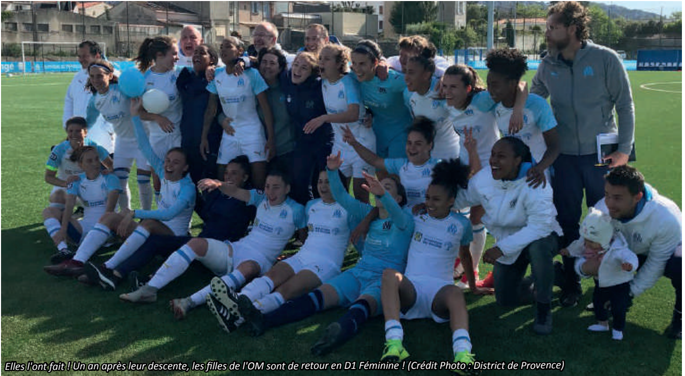
Elles l'ont fait ! Un an après leur descente, les filles de l'OM sont de retour en D1 Féminine !

Le dimanche 28 avril 2019, les filles de l'Olympique de Marseille disputait l'ultime match de leur championnat de D2 Féminine (Groupe B) face à Croix de Savoie Ambilly. Leader du classement au coup d'envoi avec 1 point d'avance sur l'AS St-Etienne, l'OM devait absolument s'imposer. Aussitôt dit, aussitôt fait, victoire 3 à 0 des Olympiennes !