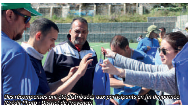
Des récompenses ont été distribuées aux participants en fin de journée

En fin de journée, des récompenses ont été distribuées à l'ensemble des participants pour venir clôturer cette 4e édition de "Tous Foot". Merci au Club du St-Henri FC pour l'accueil et à tous les participants ! Vivement la 5e édition l'année prochaine ! Bientôt, retrouvez la vidéo de la journée sur nos réseaux sociaux et notre site internet.