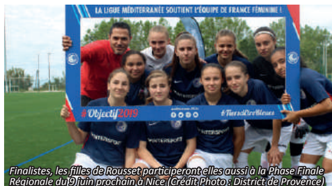
Finalistes, les filles de Rousset participeront elles aussi à la Phase Finale Régionale du 9 juin prochain à Nice

C'était une très belle manifestation. Je trouve que le District de Provence a fait quelque chose de très bien en l'organisant. Très contents d'y avoir participé. On a fait un beau parcours. Plein de filles ont pris du plaisir et c'est le plus important. Pour moi, ce genre de manifestation fait avancer le football féminin.