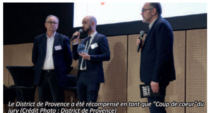
Le District de Provence a été récompensé en tant que "Coup de cœur" du jury

Après avoir passé avec brio l'étape régionale du programme « Fais-nous rêver » le 15 avril 2019 à Marseille, puis la présentation au niveau nationale à Paris le 18 avril, le District de Provence avait rendez-vous à la Maison du Handball le 19 avril dernier pour la remise des récompenses. Présent lors de cette cérémonie, le District de Provence s'est vu distinguer pour ses actions réalisées dans le cadre de l'insertion et de la réinsertion de la jeunesse, avec l'organisation du forum foot emploi et la mise en place d'interventions en collaboration avec la PJJ (Protection Judiciaire de la Jeunesse) au sein de l'Établissement pour Mineur de la Valentine. Celles-ci ont été primées par le jury en tant que « coup de cœur », face à plus de 300 candidatures étudiées. Une véritable fierté pour le District de Provence de voir ses actions valorisées et récompensées.