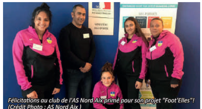
Félicitations au club de l'AS Nord Aix primé pour son projet "Foot'Elles"!

Le District de Provence est fier et tient particulièrement à féliciter le club de l'AS Nord Aix, également récompensé lors du concours « Fais-nous rêver » pour son projet « Foot'Elles », valorisant le football féminin. Toutes nos félicitations !!!