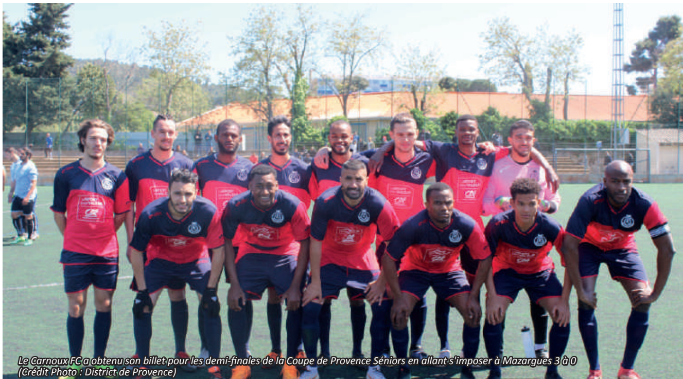
Le Carnoux FC a obtenu son billet pour les demi-finales de la Coupe de Provence Séniors en allant s'imposer à Mazargues 3 à 0

Le 5 mai dernier, l'AS Mazargues et le Carnoux FC s'affrontaient au Stade Eynaud dans le cadre des 1/4 de finale de la Coupe de Provence Séniors. Dominateurs durant la quasi totalité de la rencontre, les Carnussiens s'imposent 3 buts à 0 et seront présents dans le dernier carré de la compétition. Retour sur cette rencontre.