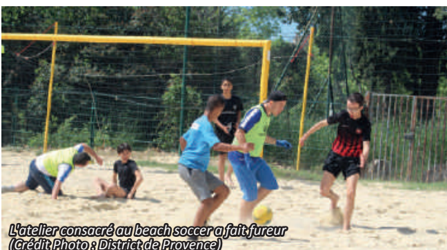
L'atelier consacré au beach soccer a fait fureur

Lors de cette belle journée ensoleillée, les participants ont dans un premier temps participé à plusieurs ateliers animés par les jeunes licenciés du St-Henri FC et la Commission Technique du District de Provence: coordination, PEF, beach soccer ou encore cécifoot était au programme durant cette matinée.