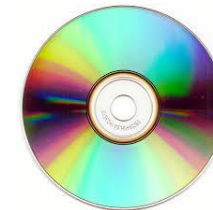
Support type CD ROM