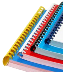
Dossier avec reliure