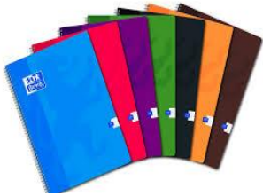
Cahier a spirales