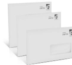
Enveloppe avec plastique