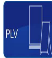
PLV et autre catalogue