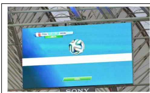
Image du ballon qui franchi la ligne de but